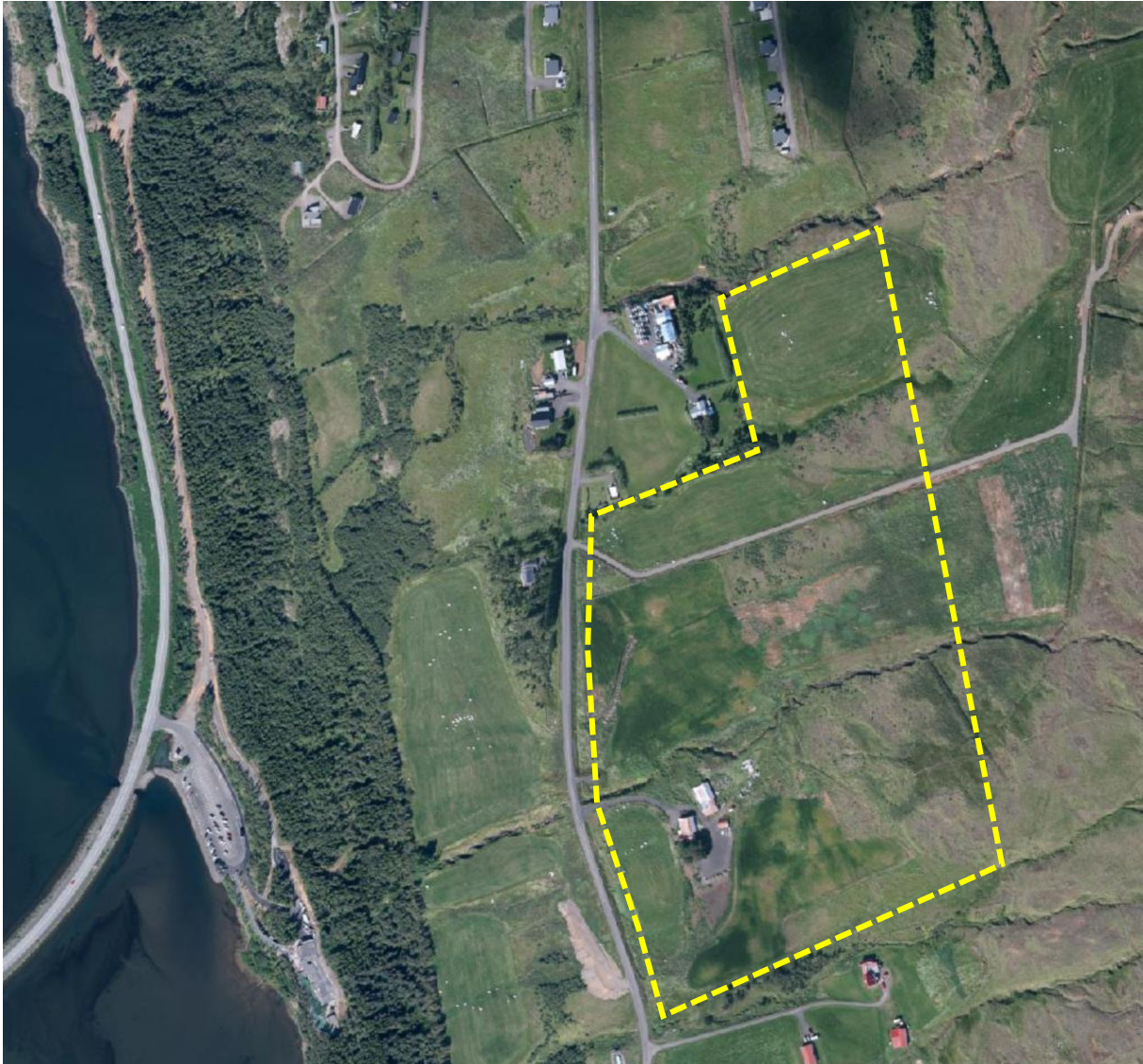
Mynd 1. Skipulagssvæði deiliskipulagsins er afmarkað með gulri línu.

Í gegnum skipulagssvæðið liggja tveir vel lækjarfarvegir sem eru vel grónir og með trjáþyrpingum. Á hluta svæðisins eru að mestu aflögð tún og ræktarland en á hluta svæðisins eru melar sem er að hluta til eru grónir trjáþyrpingum.