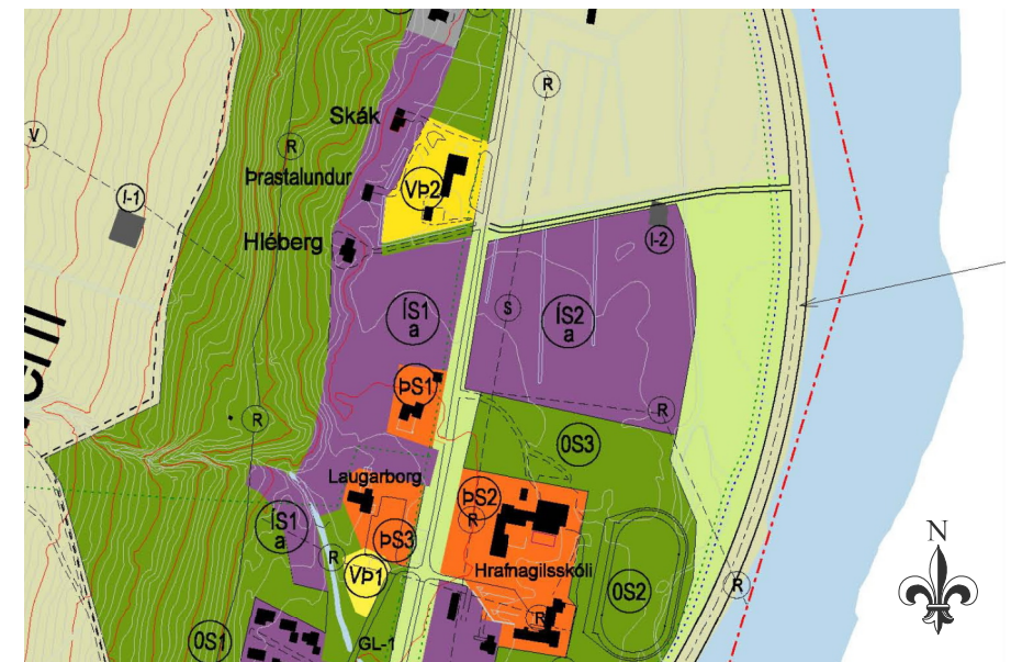
Aðalskipulag Eyjafjarðarsveitar 2005-2025

Breytingin hefur hvorki áhrif á menningarmínjar né náttúrufrar svæðisins. Fjölgun íbúða felur í sér minni háttar aukningu umferðar, sem þó verður innan eðlilegra marka miðað við byggðamynstur svæðisins. Fjölgun íbúða bætir nýtingu svæðisins og gefur kost á fjölbreyttari íbúðagerðum en ella.