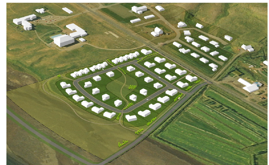
Einfalt landlíkan sem sýnir breytt skipulag

SAMÞYKKT Deiliskipulagsbreyting þessi sem auglýst hefur verið skv. 41. gr. skipulagslaga nr 123/2010 var samþykkt í sveitarstjórn Eyjafjarðarsveitar