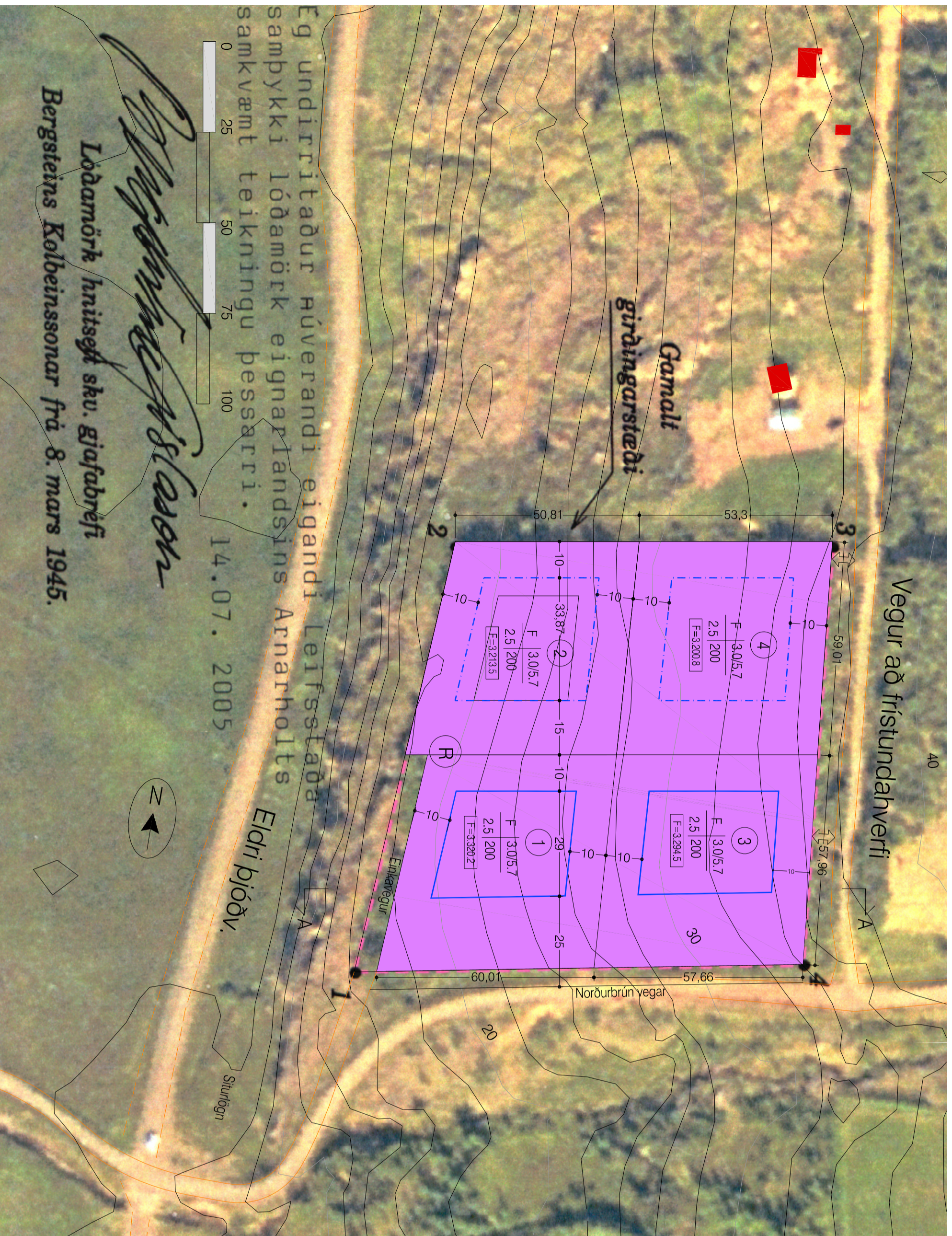
Deiliskipulagstillaga - mkv. 1:1000