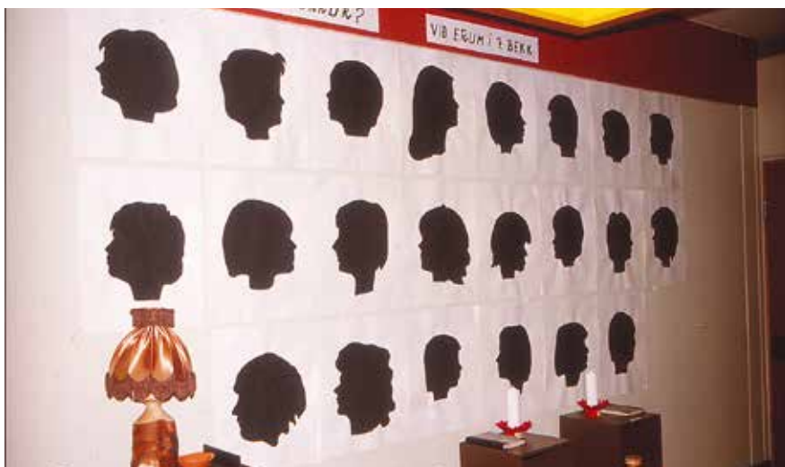
Andlitsmyndir gerðar í myndmennt af árgangi 1964

Greinin er endurbirt vegna mistaka í síðustu útgáfu.