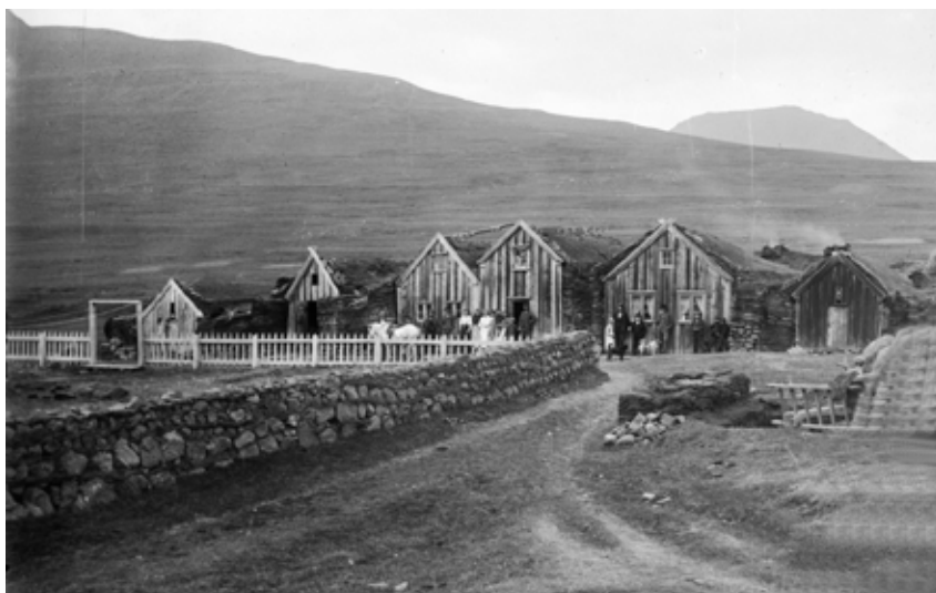
Gamli torfbærinn í Saurbæ var kominn að fótum fram þegar ungu presthjónin riðu þar í hlað sumarið 1920