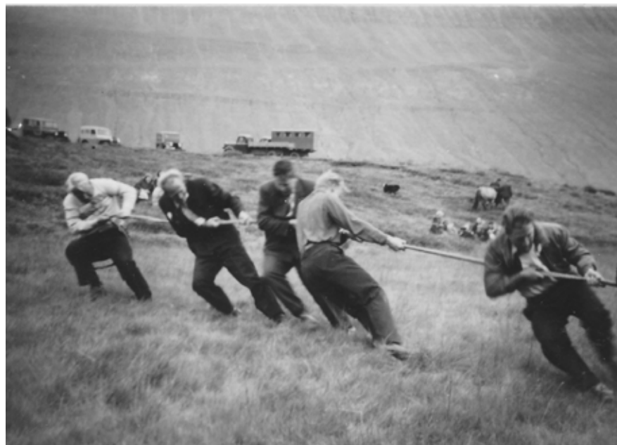
Á Leyningshóladögum var oft tekið vel á í Hestláginni.

Leyningshóladagurinn var fjóröflun fyrir Bindindisfélagið Dalbúann