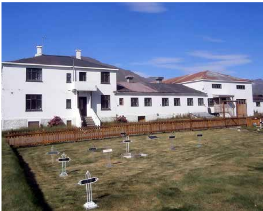
Svona líta bæjarhúsin í Saurbæ út í dag; muna fífil sinn fegurri og reisulegri