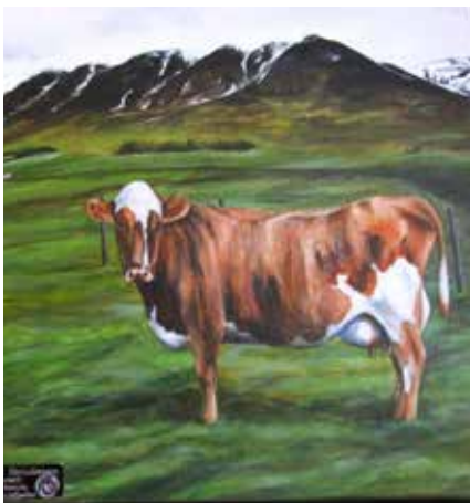
Málverkið af Doppulínu

eftirminnileg eins og Sokki 59018, sem var nú reyndar að syngja sitt síðasta þegar ég var að byrja hér. Aðalverkefnið mitt á Hvanneyri var að gera upp skýrslur yfir 1. kálfs kvígur í tíu ár, eftir feðrum. Fyrsta árið sem ég vann með voru Sokkadæturnar með algera yfirburði. Svo smám saman fóru yngri nautin að síga framúr og það endaði með því að þær voru komnar undir meðaltal. Það var augljóst mál að hann var notaður of lengi og í dag dytti engum manni í hug að nota naut í tíu ár! Eitt af því fyrsta sem ég gerði eftir að ég kom upp í Lund var að heimsækja þau bú þar sem fyrirfyndust dætur nautanna Hrafns 65008 og Rikka 65009. Þessi naut höfðu reynst þokkalega í afkvæmaprófunum á Lundi en virtust svo ekki skila því þegar út til bænda kom. Dætur Rikka voru reyndar þokkalega afurðasamar en misjafnar í öðrum mikilvægum eiginleikum. Hrafnsdætur voru í meðallagi með afurðir en þægilegar og vinsælar kýr. Svo var skýrsluhaldið tölvuvætt um það leyti sem þú varst að byrja.