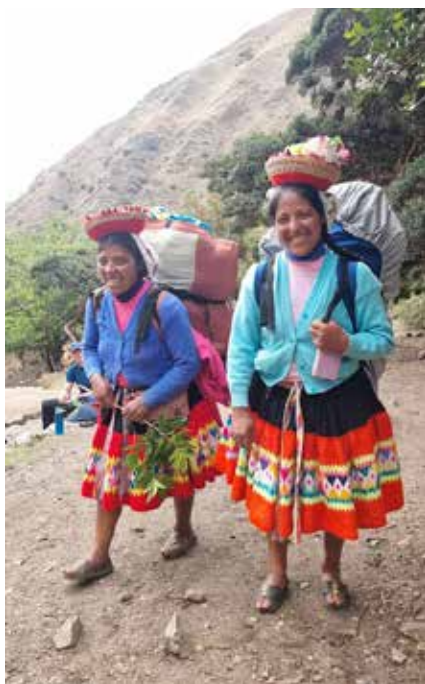
Systur sem vinna sem burðarmenn