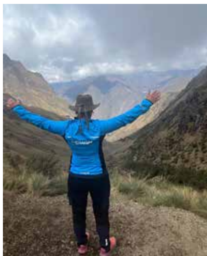
Dead Womans Pass

hæð og þar fengum við hluta af hádegisverðinum, því kokkurinn vildi ekki að við borðuðum of mikið fyrir erfiðasta hluta ferðarinnar sem var framundan. Áfram héldum við eftir stígnum sem er að stórum hluta steinlagðar tröppur upp í skarð sem nefnist Warmihuanusca eða Dead Woman's