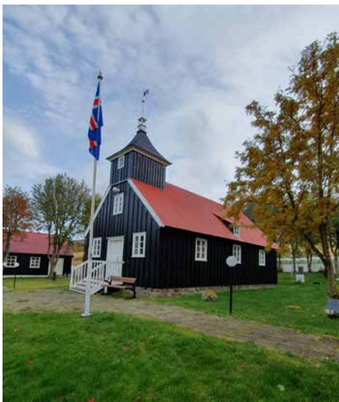
Kapítulið og Munkaþveráarkirkja nýmáluð