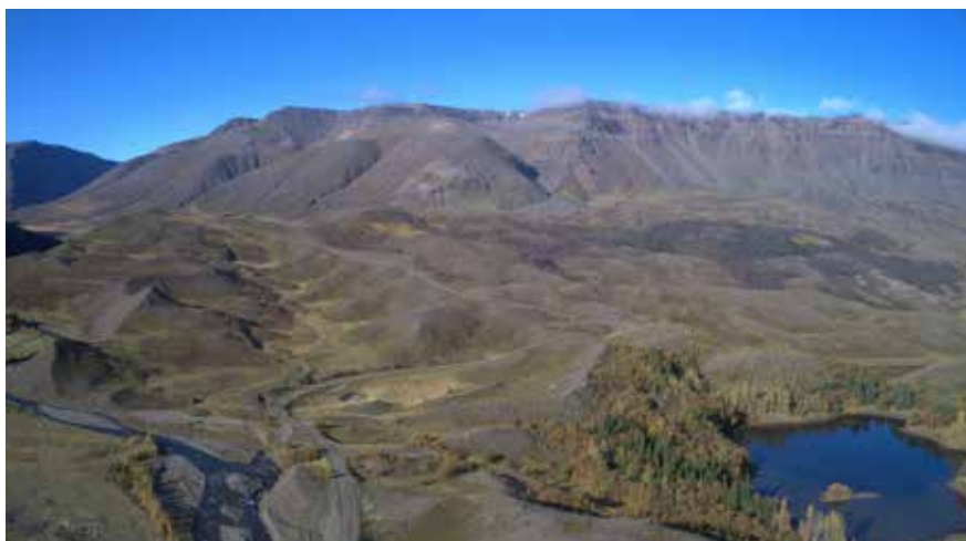
Leyningshólar fyrir mynni Villingadals. Torfufellsá og Tjarnargerðisvatn

Því miður á ég enga heildarmynd frá þessum dögum, þurfti að leita heimilda hér og þar. Fyrir mig var þetta holl og þörf vinna. Ég hef spurt marga og fundið á netinu nokkrar auglýsingar og fréttir í blaðinu Degi.