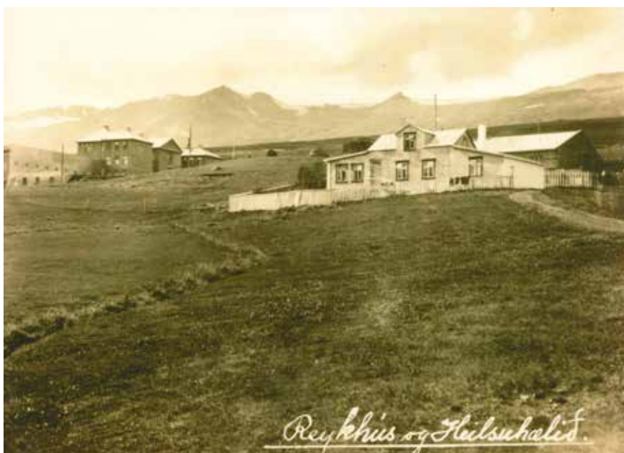
Reykhús og Heilsuhælið