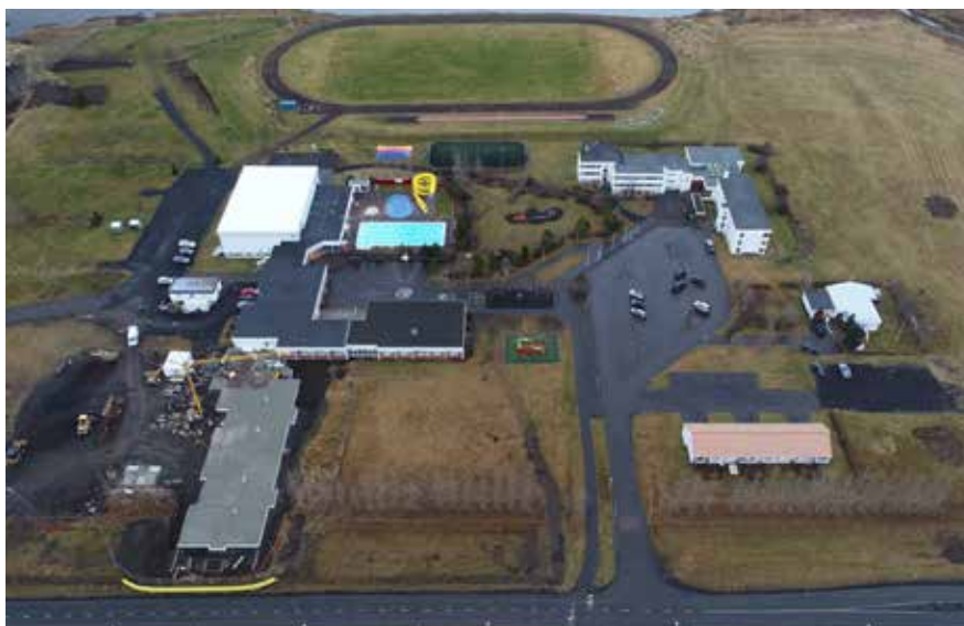
Svona lítur skólasvæðið út í dag. Bygging leikskólans er komin af stað og til stendur að stækka grunnskólann enn frekar

Sem betur fer er þetta ekki alveg rétt. Haustið 1963 hófst kennsla í unglíngadeildum í barnaskólunum í Sólgarði og á Hrafnagili. Á báðum stöðum var kennt námsefni 1. bekkjar gagnfræðastigsins eftir því sem tók voru á. Ári síðar hófst svo samvinna þessara skóla. Veturinn 1964-1965 var í Sólgarði kennt námsefni 2. bekkjar og lauk fyrsti nemendahópurinn unglíngaprófi vorið 1965. Árin 1964-1966 var svo öðrum hópi úr báðum hreppum kennt sama efni á Hrafnagili. Var þessu skipulagi haldið