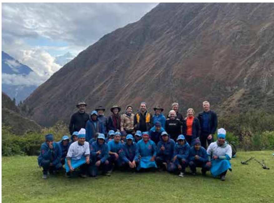
Hópurinn ásamt leiðsögu- og burðarmönnum

nú borðhaldið, í forrétt var afar ljúffeng grænmetisúpa, sem í sjálfu sér hefði dugað sem hádegisverður, en svo fóru aðalréttirnir að birtast einn af öðrum, fiskréttur, eggjaréttur, hrísgrjón, salat, pastaréttur og ýmislegt fleira. Allt var þetta skreytt svo fallega að sómt hefði sér vel á borðum finustu veitingahúsa. Seinni part dagsins var gangan aðeins meira á fótinn og í lok dags komum við á fyrsta tjaldstað sem nefnist Wayllabamba og er í um 3.000 m hæð. Mjög flott tjaldstæði og útsýnið stórkostlegt. Þegar við komum voru burðarmennirnir okkar búnir að tjalda fyrir okkur og búa um, við þurftum ekki einu sinni að taka svefnpokana upp, hita vatn til að þvo okkur og svo fengum við te og popp meðan við vorum að bíða eftir kvöldmatnum sem var af svipuðum toga og hádegismaturinn nema öllu íburðarmeiri. Við fórum því södd og sæl að sofa eftir fyrsta göngudaginn.