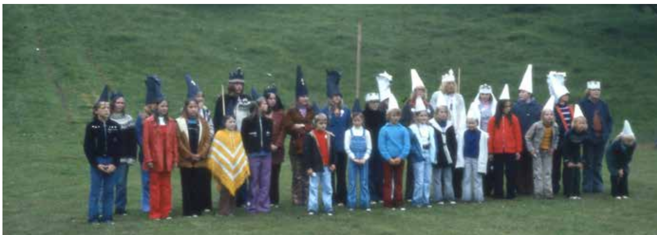
Leyningshóladagur 1973 - lifandi manntafl í Hestláginni. Eftir snarþa baráttu á taflborðinu röðuðu taflmennirnar sér upp til myndatöku.