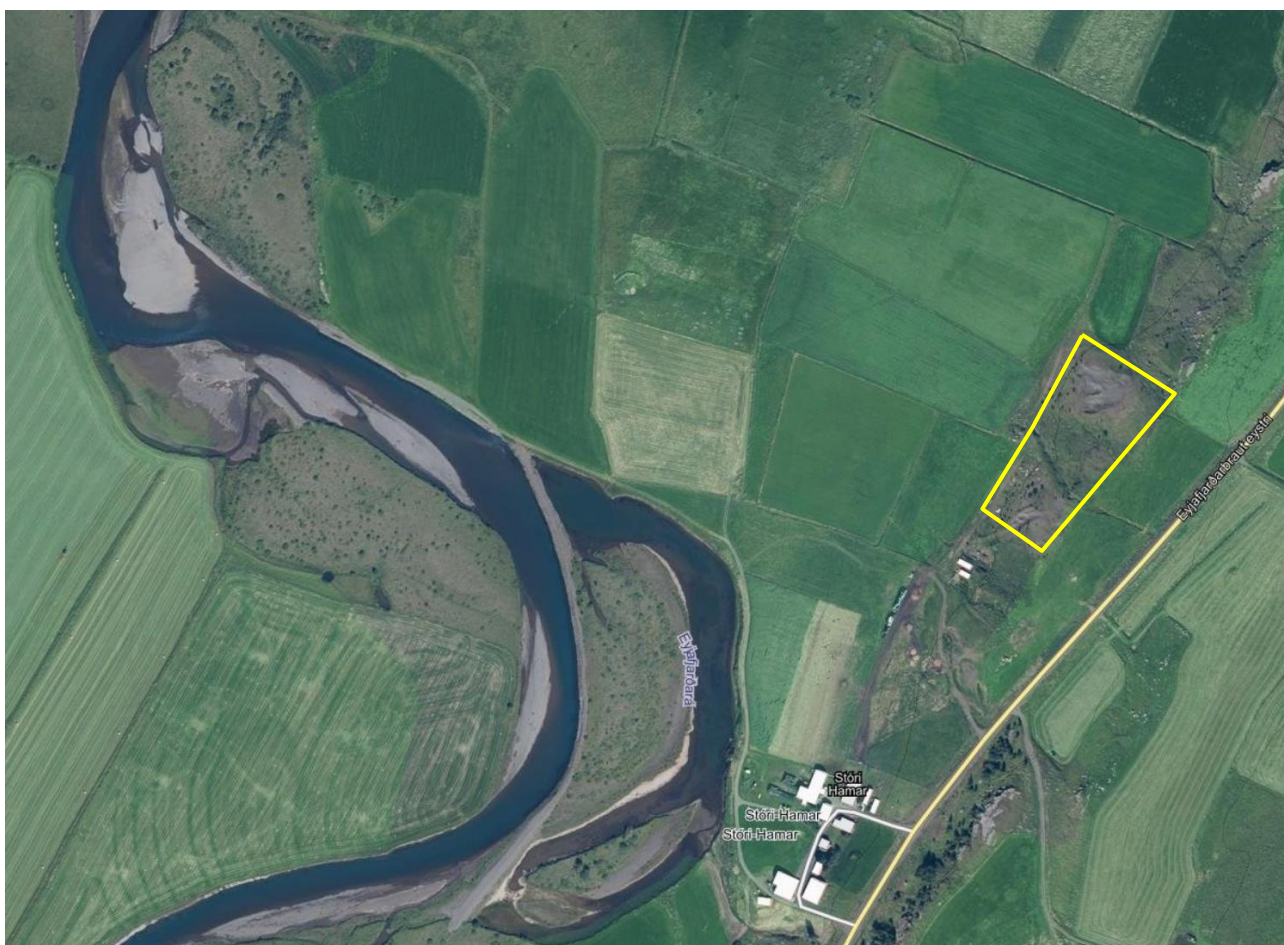
Mynd 1. Afmörkun fyrirhugaðs efnistökusvæðis afmarkað með gulri línu.