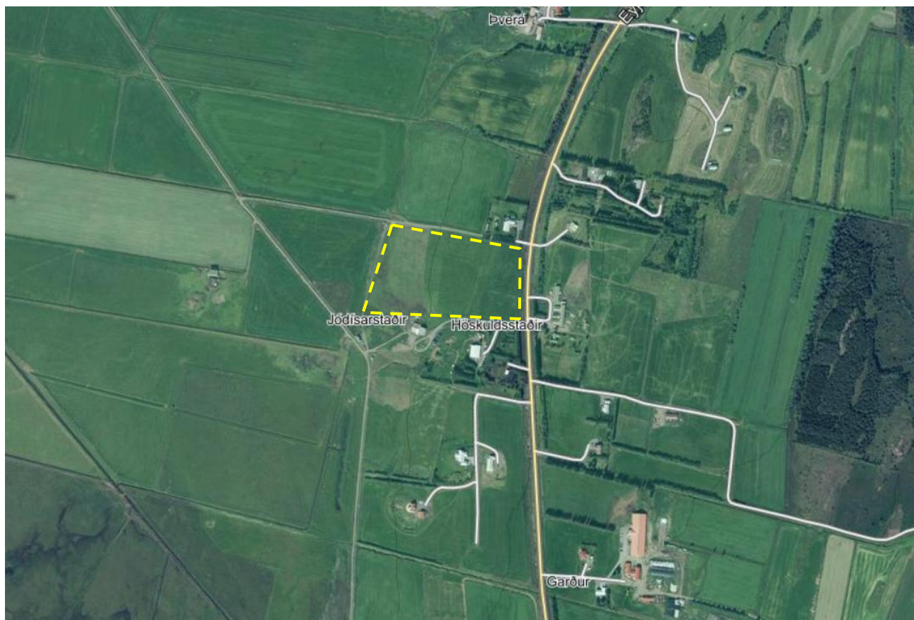
Mynd 1. Afmörkun fyrirhugaðrar stækkunar íbúðarsvæðis, afmarkað með gulri brotalínu.

Svæðið sem stækkunin nær til er ræktað land norðan bæjartorfunnar við Jódísarstaði og að landamerkjum við Ása. Stærð svæðisins er um 4 ha.